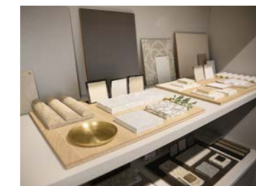
Hohe Qualität, stimmiges Arrangement und zeitloser Stil.